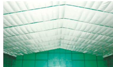
■照明工事 ■燃え抜け防止