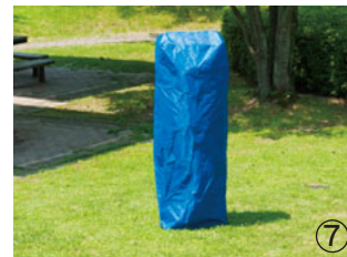
※付属品…①付属品収納袋 ②張ローブ(樹脂フック付) 4本 ③杭(L=290m/m) 4本 ④ボックスレンチ ⑤六角レンチ 1本 ⑥キャリーバック ⑦フレームカバー