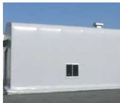
■ルーフファン ■明かりとり