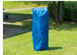
※付属品…①付属品収納袋 ②張ローブ(樹脂フック付) 6本 ③杭(L=290m/m) 6本 ④ボックスレンチ ⑤六角レンチ 1本 ⑥キャリーバック ⑦フレームカバー