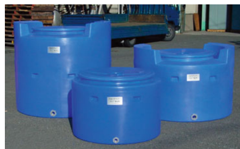
活魚コンテナ(集合)