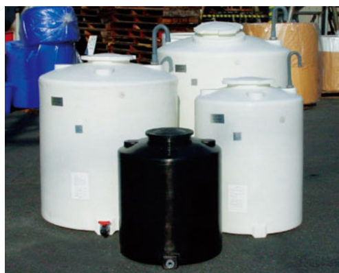
密閉型タンク(集合)