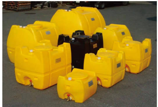
ローリータンク(集合)