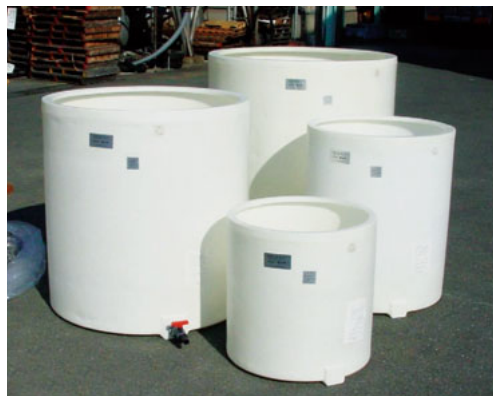
開放型タンク(集合)